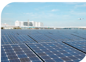
川崎大規模太陽光発電所(浮島)