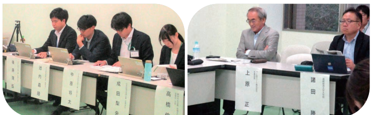
日本政策金融公庫前橋支店との意見交換会の様子（2024年10月3日）

対照的に、日本の土地利用型農業、特に水田農業では、経済成長に伴う所得の上昇に農地の集積がはるかに及ばなかったため、“兼業化、というかたちで適応がはかられてきました。ただし、ある種、安定状態にあるかのようにみえた“兼業農業、は「昭和一桁世代」（2010年ですべて75歳以上）のリタイアともあいまって急速にその持続性を喪失させつつあります。そこで、異業種、特に、地域の建設業からの土地利用型農業、水田農業への参入が、その再建への一歩を導くのか、否かについても全国各地の実態から解明を進めています。その際、食用米の恒常的生産過剰と飼料穀物の自給基盤の未確保といった隘路を切り拓くためにも食用米の飼料化といった点に着目しながら研究を進めています。